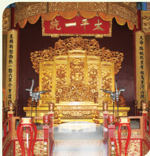
傳言麻將或由太平軍創制或改良，圖為南京洪秀全御座。