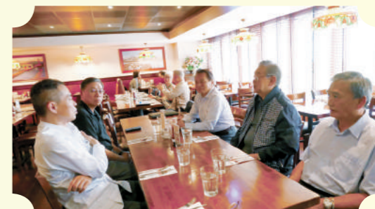
餐敘時，突遇四級地震，餐廳搖晃劇烈。