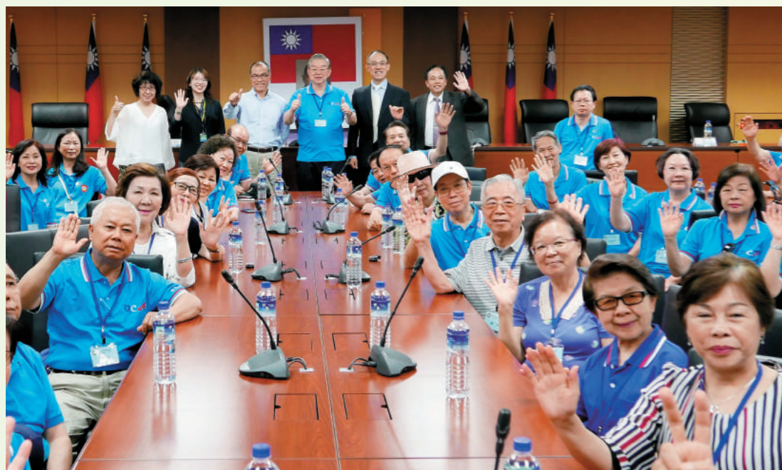
上圖：黃理事長致贈高雄市政府卷軸。下圖：全體合照。