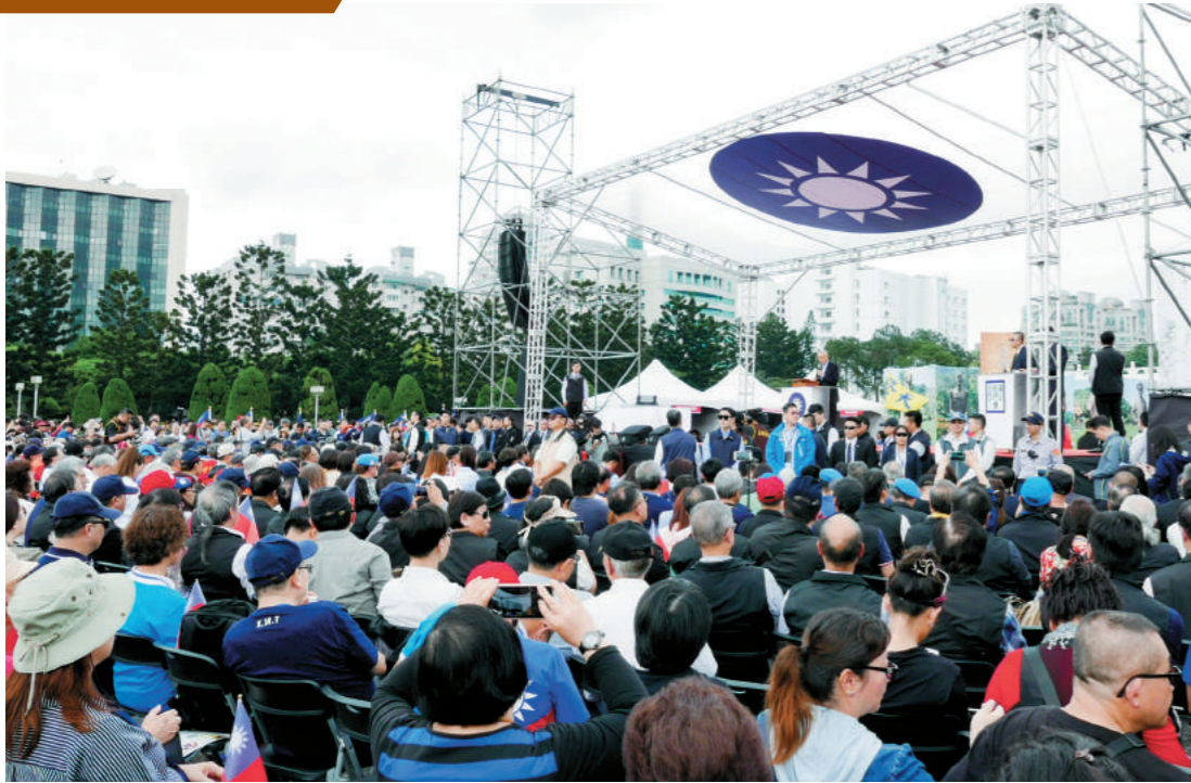
中國國民黨主席吳敦義帶領大家，慷慨激昂高喊「蔣公偉大常留人間」。

基礎。經濟建設方面，首先推動耕者有其田，釋放了農村的勞動力，接著發展進口替代工業，增加台灣出口競爭力，為下一步的經濟起飛做好準備。而在社會文化建設方面，指示宋美齡女士親自推動廢除養女制度，推動九年義務國民教育以及復興中華文化運動，保存了中華文化在台灣的火苗。這些建設就是台灣能成為今日台灣的基石。