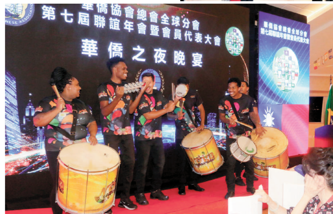
上圖：詹前副主任致詞祝賀大會圓滿成功落幕。下圖：森巴舞隊為晚宴助興。