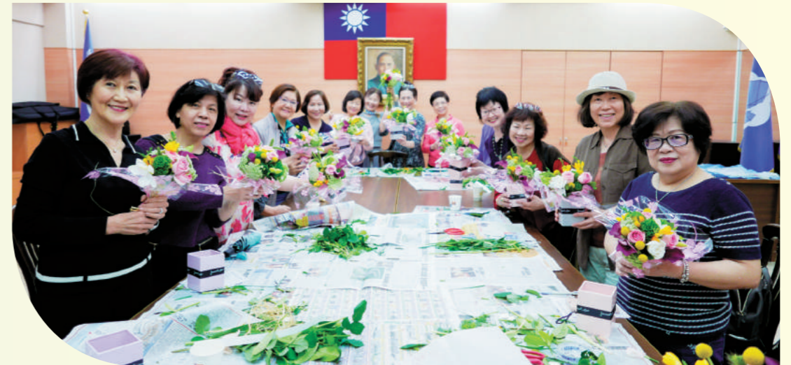
參加會員展現花藝成果。