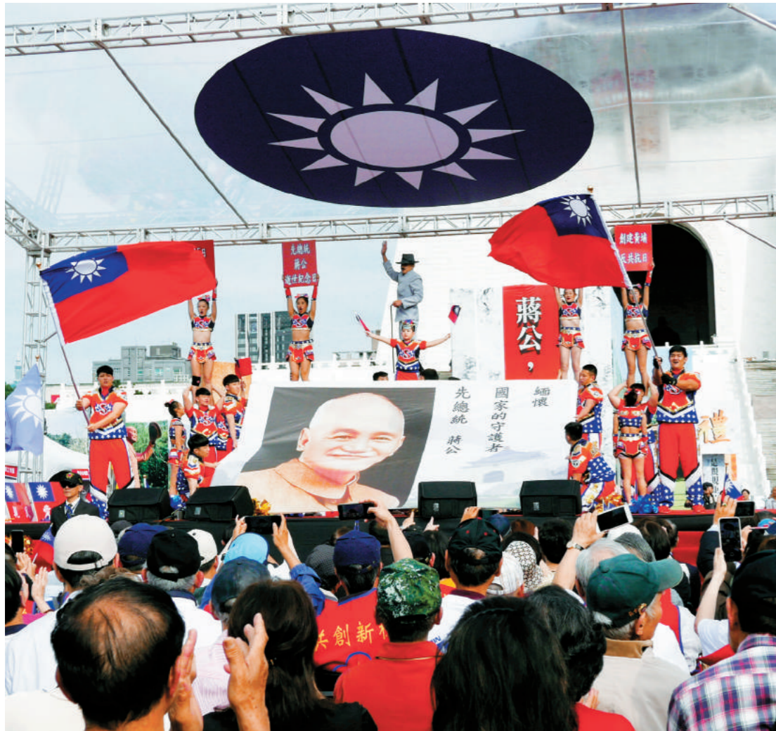
世新大學啦啦隊表演。