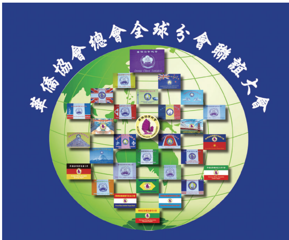
華僑協會總會全球分會聯誼大會會旗。

一、尊崇國父，支持中華民國：紀念國父誕辰獻花致敬，舉辦國父思想學術研討會，發揚國父暨華僑先烈先賢建國愛國革命精神。邀請國父孫女孫穗芳博士來台舉辦紀念國父誕辰暨全球華僑慶祝華僑節聯誼大會與華僑國是論壇，強烈支持中華民國及三民主義永續