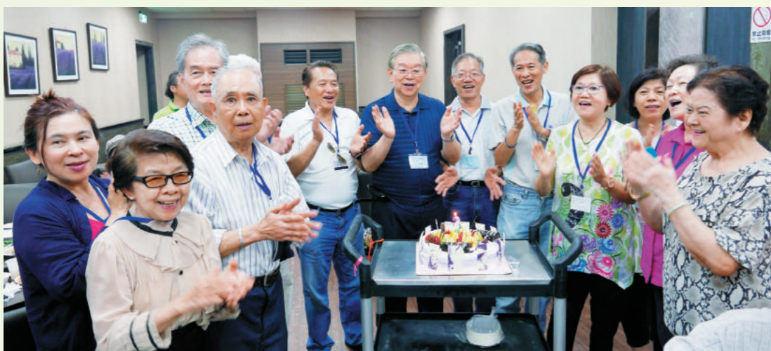
上圖：左營古城「拱辰門」眷村屋簷下與眷村阿婆話家常。下圖：為壽星慶生。