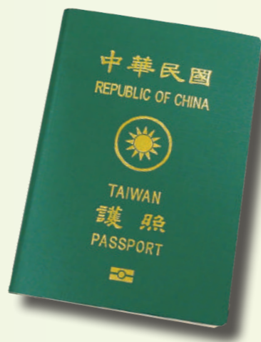
中華民國護照有效期攸關僑胞返國投票權益。

之中華民國護照基本資料頁影本，3.回郵信封（不必貼回郵），4.直接以掛號寄往原戶籍所在地之戶政事務所，5.等候投票通知單。