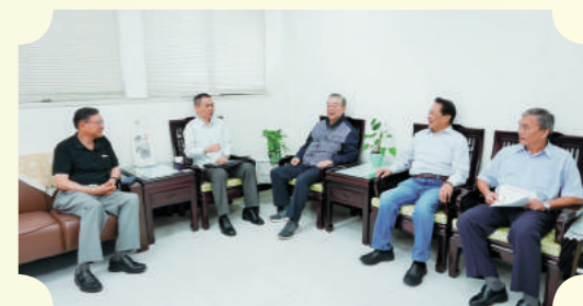
就墨爾本當地僑情交換意見。

餐廳搖晃劇烈，持續近三十秒，可真嚇人。黃理事長笑對林起文處長說，這是履新前的震撼教育。（秘書處）