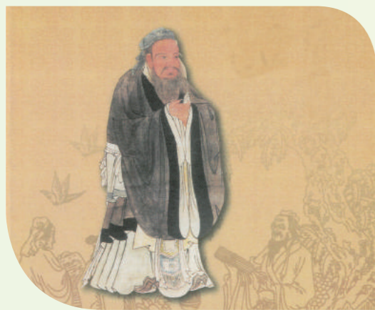
或謂麻將係由孔子發明。

根據1916年的《清稗類鈔》記載，民初有些賭客窮奢極侈，麻雀一底注額，可達白銀五萬兩；另據「十葉野聞」1917年的記述，曾任軍機大臣的慶親王奕劻，其子載振，曾設賭局，麻將一底，白銀三千兩，吸引攀附權貴之類，而載振並不露面，只暗中派人記下賭客性格，若輸掉三底仍屢敗屢戰者，即列為上等，須招呼週到；對踟躕不前者，則設法威迫，務求賭客輸個精光，