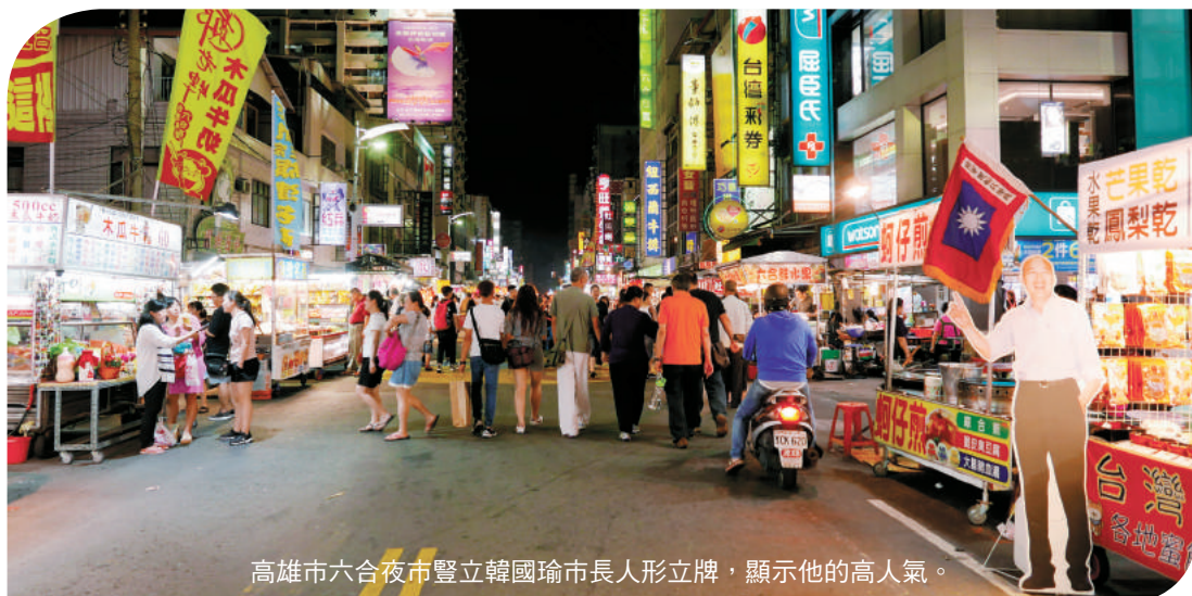
高雄市六合夜市豎立韓國瑜市長人形立牌，顯示他的高人氣。

南菜販」的口號，再到中台灣支持盧秀燕，又多次到雲林拉抬張麗善的氣勢，復又跨海到澎湖為賴峰偉站台，韓在全台的助攻，硬把民進黨築起的高牆推倒，讓原由民進黨執政的多個縣市變成藍天。韓流在全台帶動的凝聚力，至今仍然在海內外掀起聲勢澎湃的浪潮，反映出韓國瑜在九合一選舉獲得的支持已成功轉型為支持總統、立法委員選舉的群眾基礎。