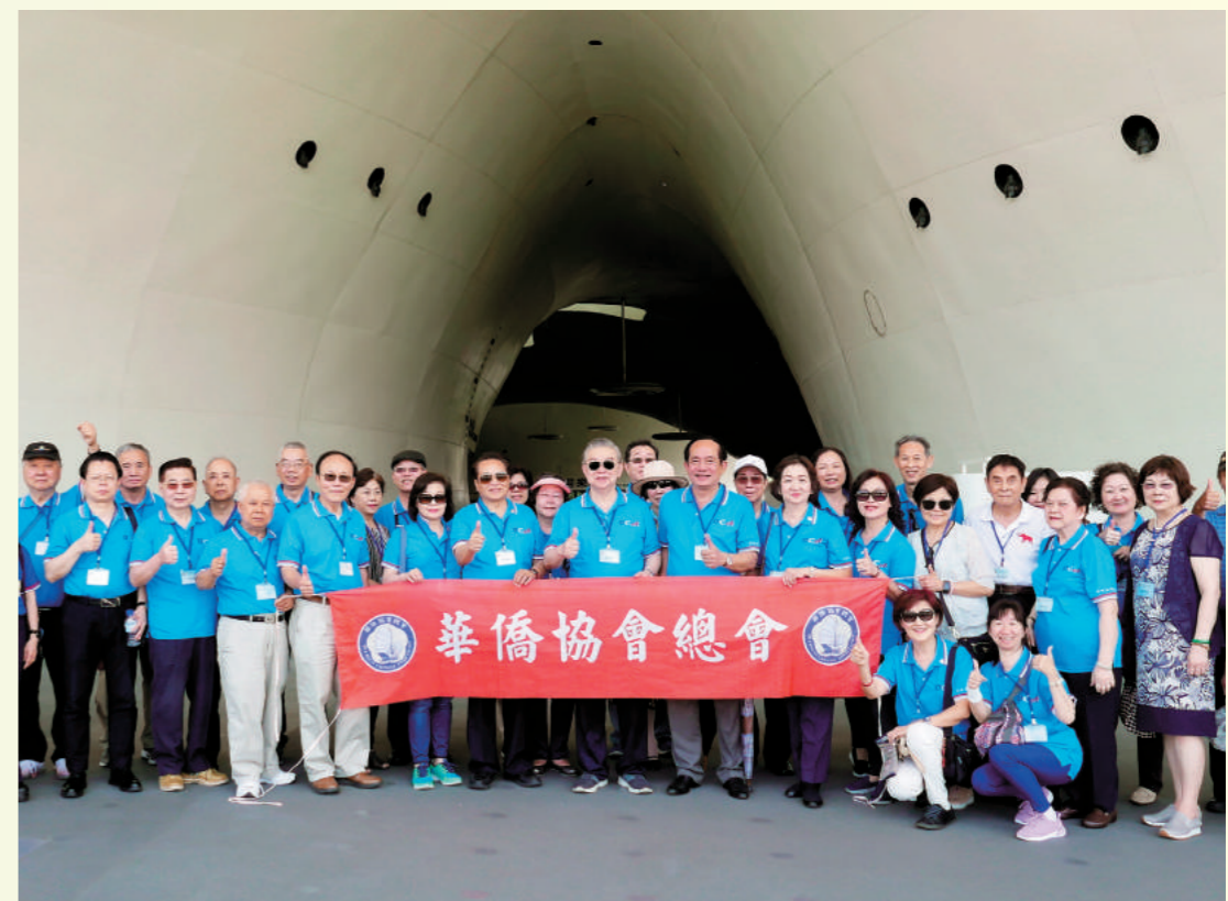
於衛武營國家藝術文化中心大合影。