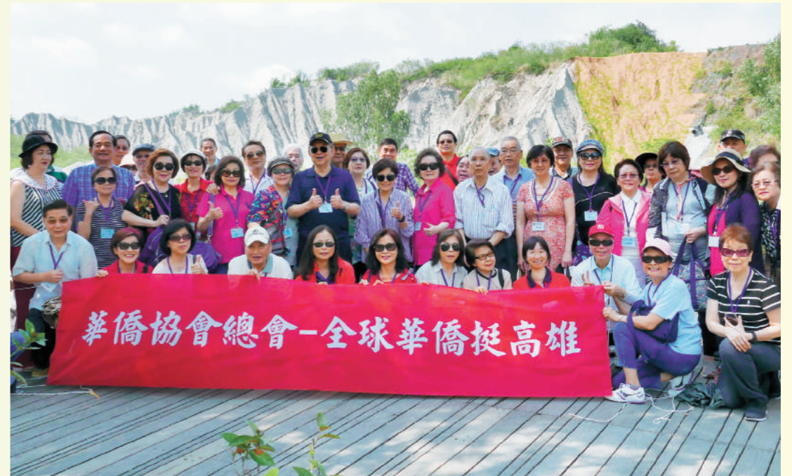
於田寮惡地月世界合照。

赴東南亞及大陸等地推銷台灣農產品，以期增加農民收入，這種放下身段，為人民做牛做馬、人飢己飢的施政風格，正是現今台灣普羅大眾所渴求的政治人物。另一方面，也感於溫室效應之影響既廣且深，現在求個風調雨順，這樣卑微的希望，竟是一種奢求。