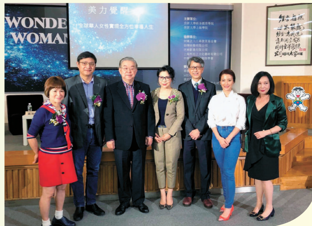
「美力覺醒」論壇嘉賓。