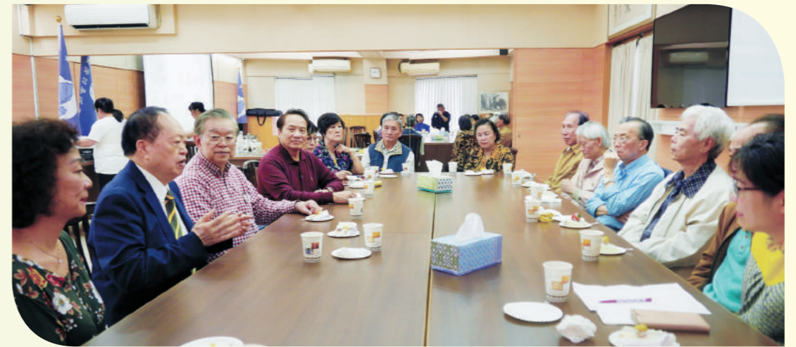
五月慶生茶會養生座談。