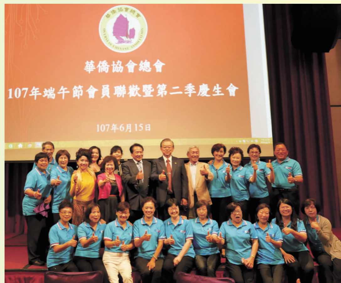
僑協舞蹈團、合唱團團員一起豎指為自己的演出比個讚。

截至目前，本會已與美洲中華公所聯誼會、中美洲暨巴拿馬六國中華/華僑總會、歐洲華僑團體聯誼會、世界越棉寮華人團體聯合總會、全美台灣同鄉聯誼會等全球重要華僑團體簽署合作及友誼協議書，締結兄弟情誼，實質做到了全球華僑事業的領航者，塑造世界華僑之家的美好形象。