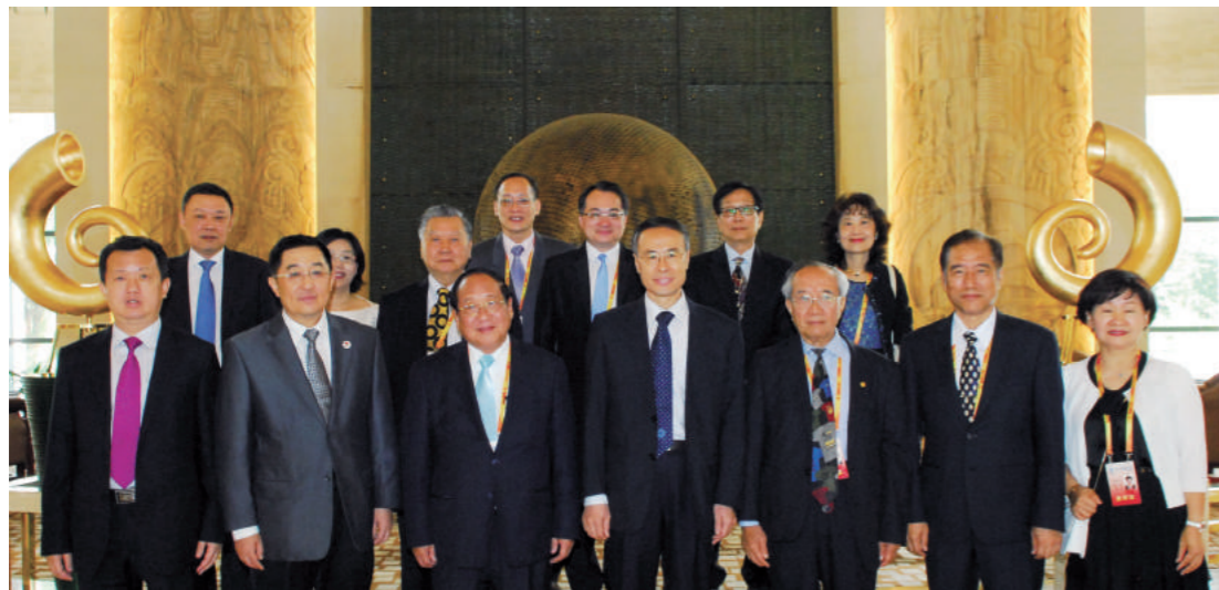
出席兩岸僑聯和平發展論壇人員合影。

影響著兩岸關係的發展。但是我認為最重要的關鍵因素與主導力量，還是在於中國大陸的發展及其政策作為。