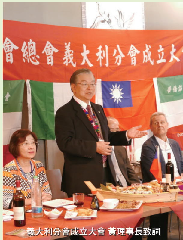
義大利分會成立大會 黃理事長致詞