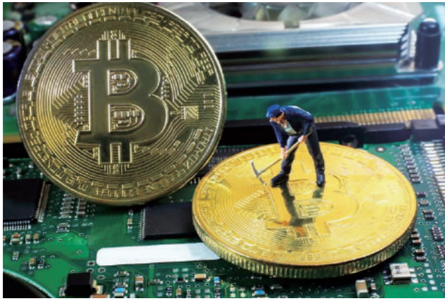
比特幣為數位加密貨幣，全球總數量至2140年將達限量的2100萬枚。圖為比特幣示意圖。