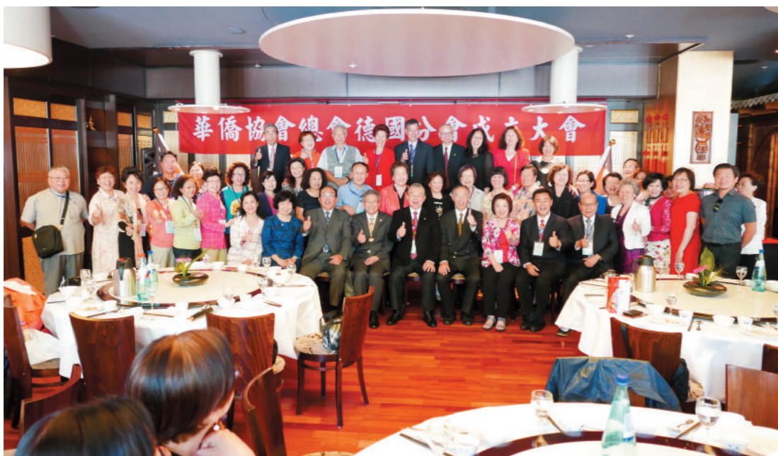
德國分會成立大會嘉賓合影。