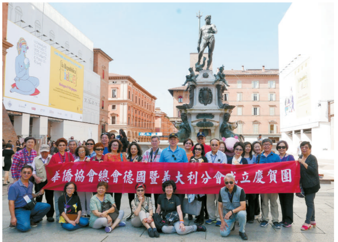
義大利波隆那海神廣場合影。