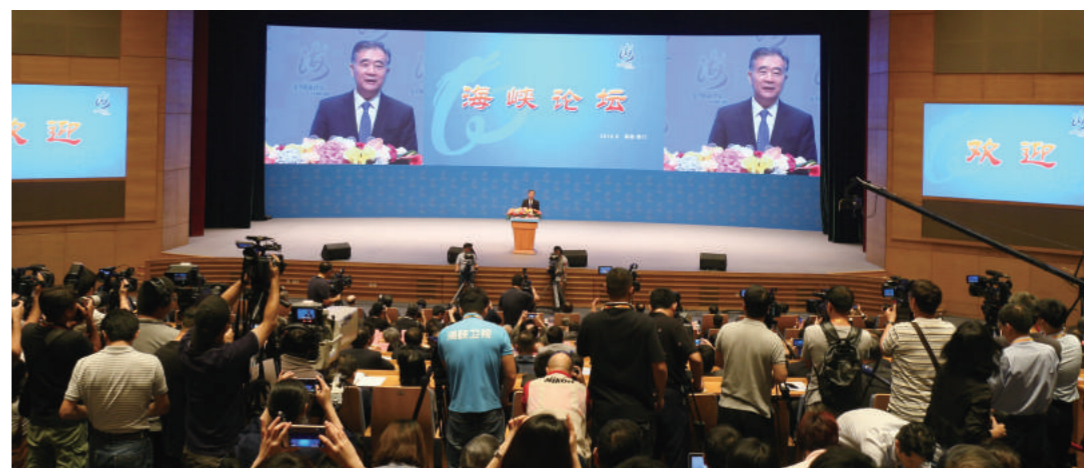
大陸政協主席汪洋在 2018 第十屆海峽論壇致詞。

先生，他說，十年來海峽論壇台灣各界參加人數已累計12萬人次，成為兩岸民間交流重要的平臺，也是至今參與機構最多、活動規模最大、涉及範圍最寬、民眾參與最廣的民間交流盛會。