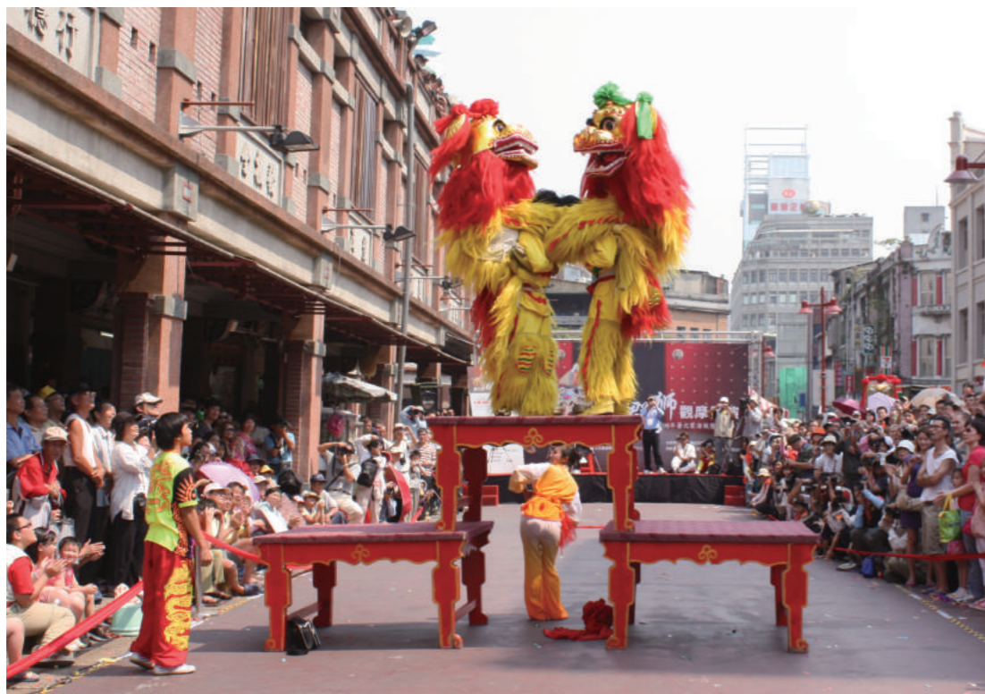
中華文化源遠流長，台灣文化是中華文化的一部份，去中國化談何容易。圖為民間舞獅活動。