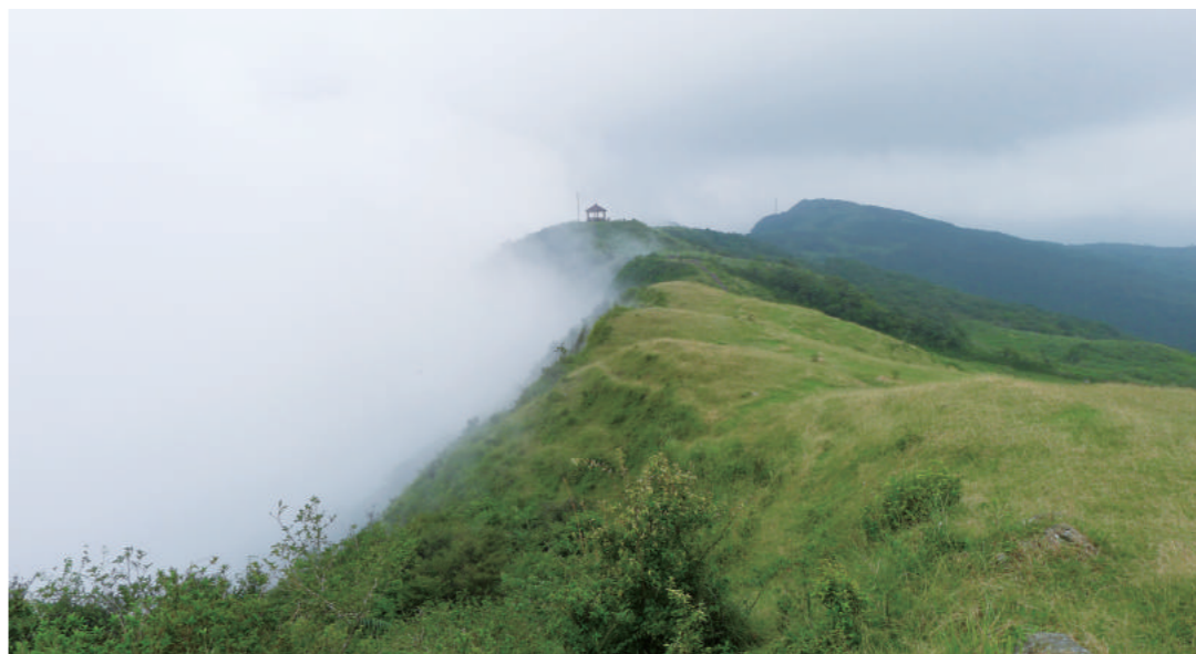
高山地形易起霧，高速飛行器進雲後，駕駛員必須小心翼翼。圖為高山起霧時，涇渭分明。

目前美空軍的F-16機隊，已經逐漸加裝自動地面防撞系統（Auto-GCAS），該系統已成標準配備，電腦可根據飛行軌跡與距地高度，發現飛機即將撞向地面時，就會發出警告。如果飛行員因為大G失能昏迷沒有反應、或是空間迷向失去上下方位，電腦系統也會自行接管飛機，強迫將飛機上升到安全高度，以挽救戰機及飛行員生命。