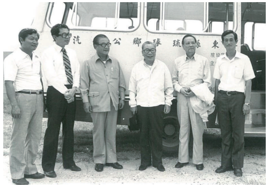
蔣經國總統（右三）下鄉探求民隱，輕車簡從。從北到南，與庶民隨緣結義。至今仍是國人津津樂道的優質好總統。

不禁想起兩蔣風格，履險如夷，乃有「以國家興亡為己任，置個人死生於度外」的「磅礴」情操，其浩然之氣，殊非一盆髒水，可以污「滅」；經國先生於五度訪美之際，為台獨份子鄭自才、黃文雄在紐約狙擊，其處變不驚的第一句話，是不忘陳問「有人受傷