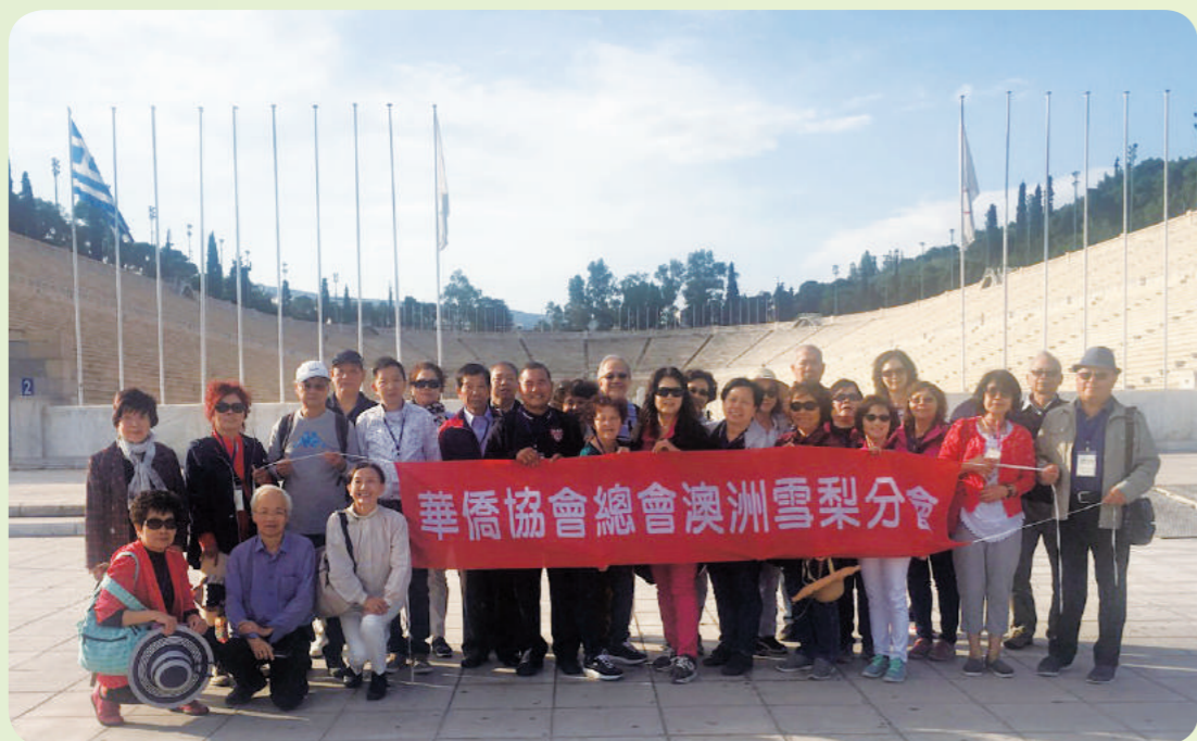
奧林匹克發源地前合影。

維蘇威火山大爆發，經考古發掘出珍貴古城遺跡。接著來到希臘雅典，參觀曾經是政治中心的雅典衛城博物館、憲法廣場、國家花園，在這裡感覺到老城市所蘊藏的文化氣息。下一站是Santorini Greece，是世界聞名白屋藍頂的傍海建築、位於山頂景色，無與倫比，沿途山路竟是Z字形崎嶇又陡峭，計有約五百多層階梯，有多樣交通工具巴士、覽車、驢子可使用，到了上山看完一定會說不虛此行，太美了！