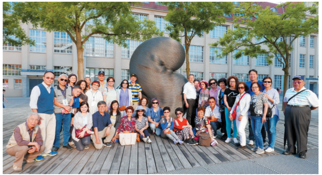
在德國卡斯魯與台灣藝術家作品合影。