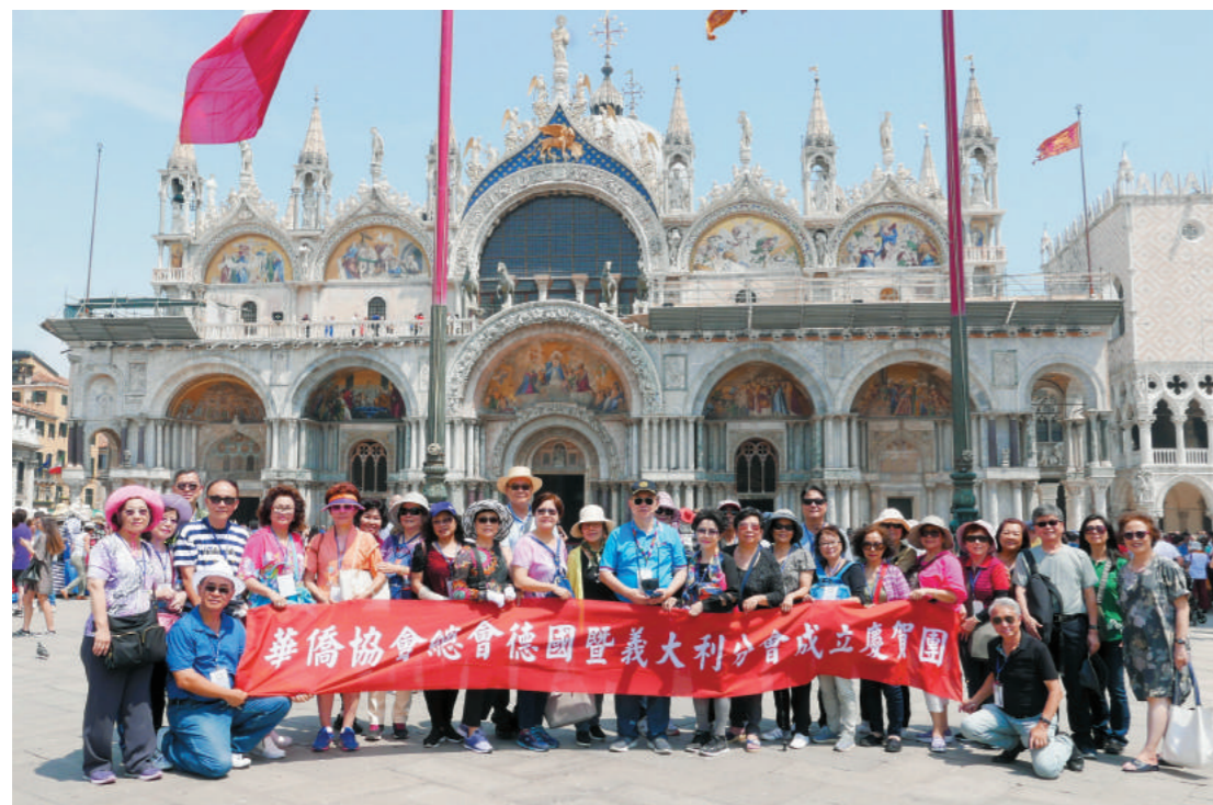
義大利威尼斯聖馬可廣場合影。