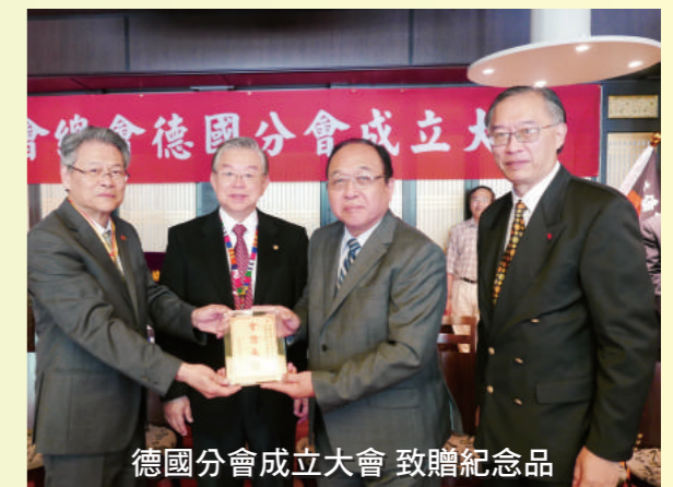
德國分會成立大會 致贈紀念品