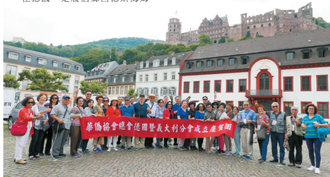
德國海德堡大學合影。