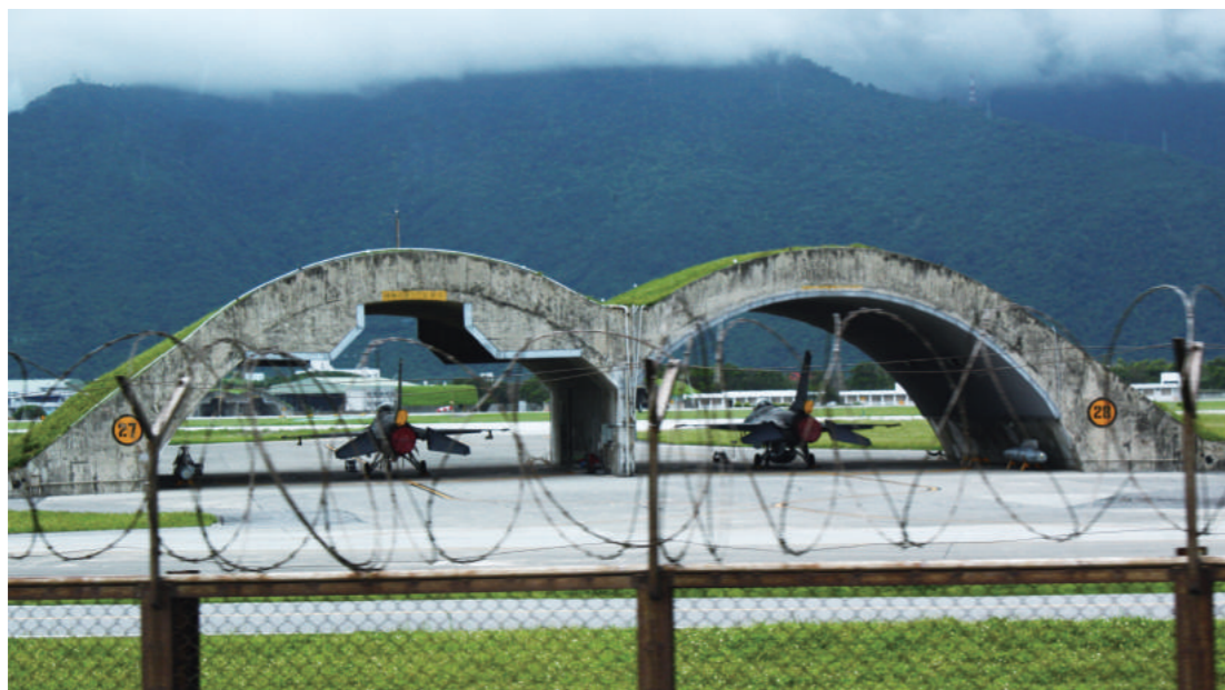
花蓮空軍基地停放於機堡的 F-16 戰鬥機。

2013/5/15空軍嘉義基地一架編號6622的F-16A戰機，疑似機械故障墜高雄外海，飛官吳彥霆中尉緊急跳傘獲救。