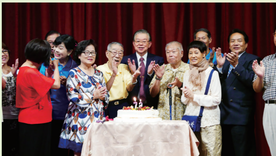
上圖：僑協舞蹈團演出敦煌〈蓮花〉。