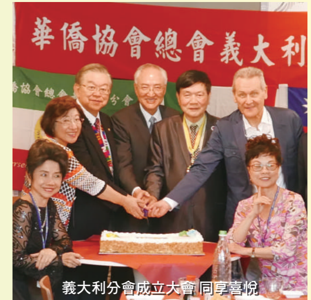
義大利分會成立大會 同享喜悅