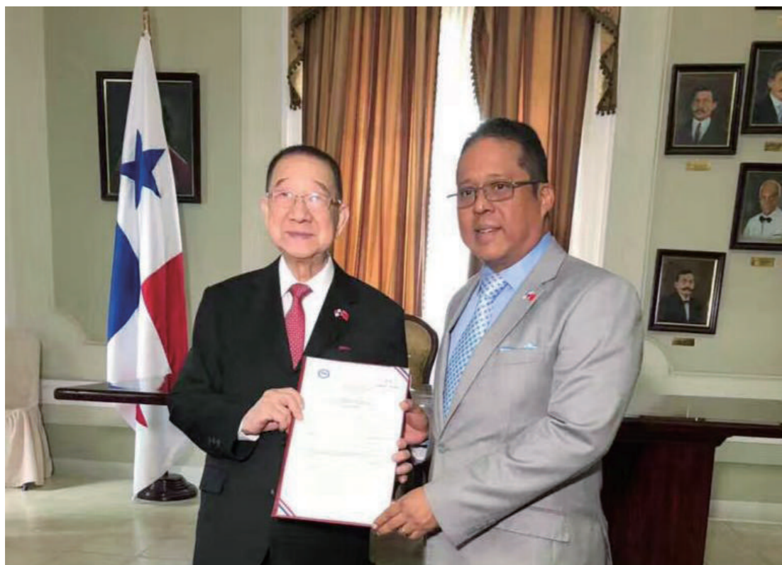
章辭修總會長（左）榮獲巴拿馬省長 Rafael Pino Pinto 頒發勳章。