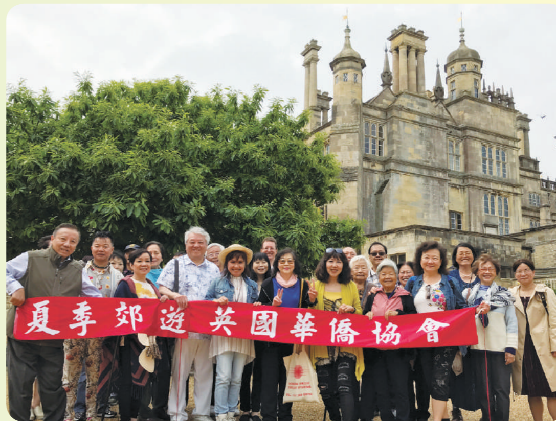
英國華僑協會遊伯利莊園。