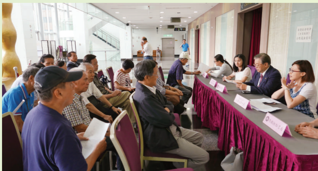
上圖：端午節會員聯歡會現場。下圖：服務會員，舉辦「公教退休金座談」。