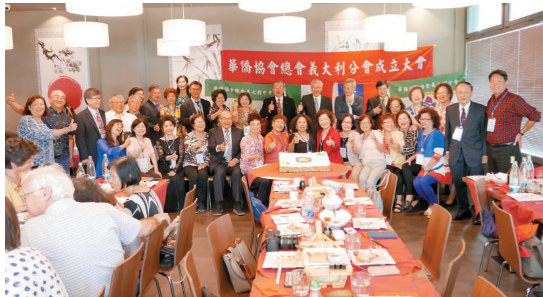
義大利分會成立大會嘉賓合影。