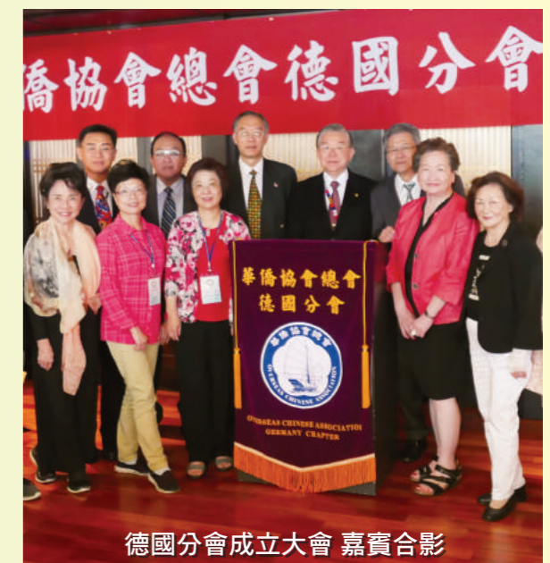
德國分會成立大會 嘉賓合影