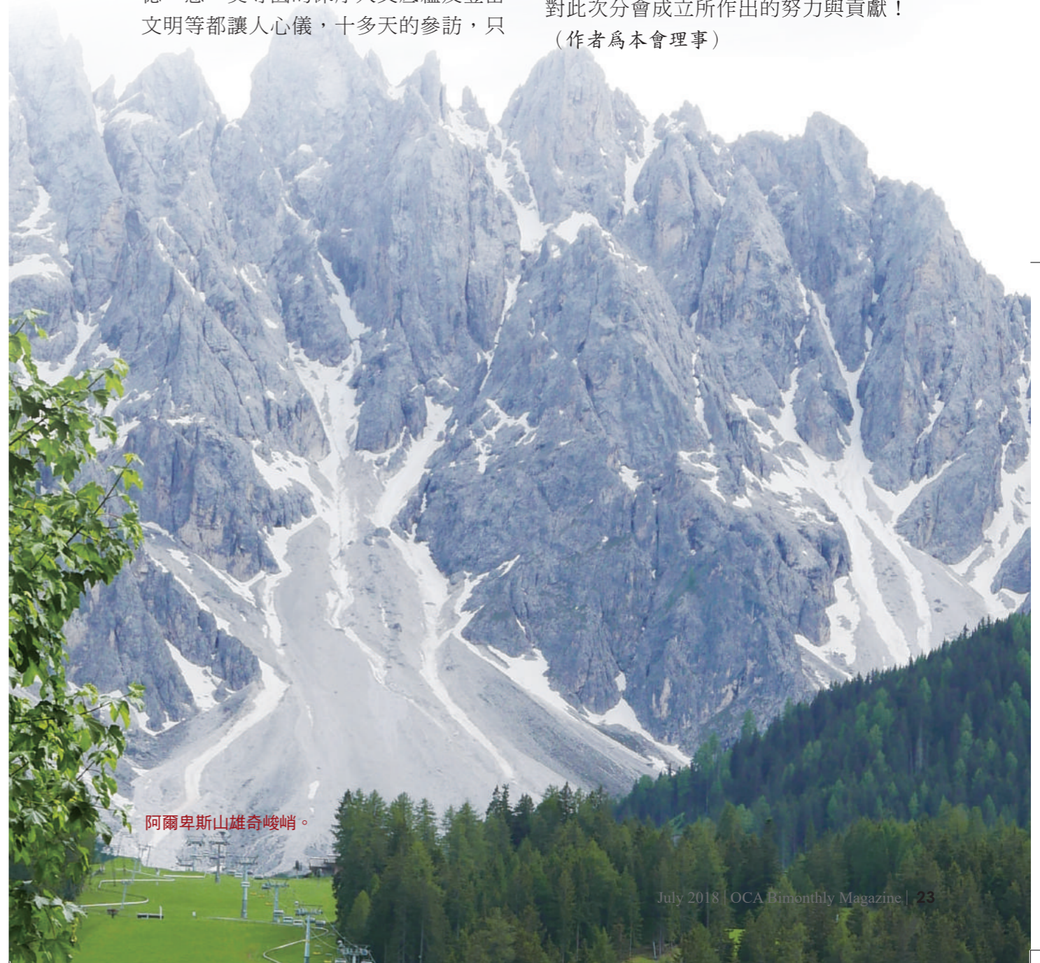
阿爾卑斯山雄奇峻峭。

最後，還是要感謝德國分會、義大利分會諸先進們的辛勞與接待，以及對此次分會成立所作出的努力與貢獻！（作者為本會理事）