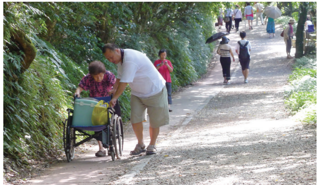
老年人行動不便，尤需家人及「瑪莉亞（外籍看護）」的照料，才能維持起碼的生活品質。圖為行動不便的媽媽由兒子協扶行走踏青。

在人口迅速老化，而新生兒日漸減少情況下，長生逐漸衍生出許多問題，首先是沈重的社會負擔。不少大陸醫生呼籲：最好能節約國家有限的衛生資源，用於更有治療希望的病人身上。據上海對兩百名老人問卷，贊成安樂死的達73%。同樣的，北京有85%認為合乎人道；80%認為中國可以實施。