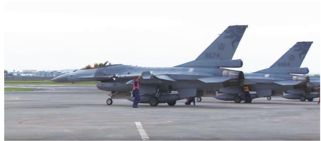
吳彥霆少校所駕的同款 F-16 戰機