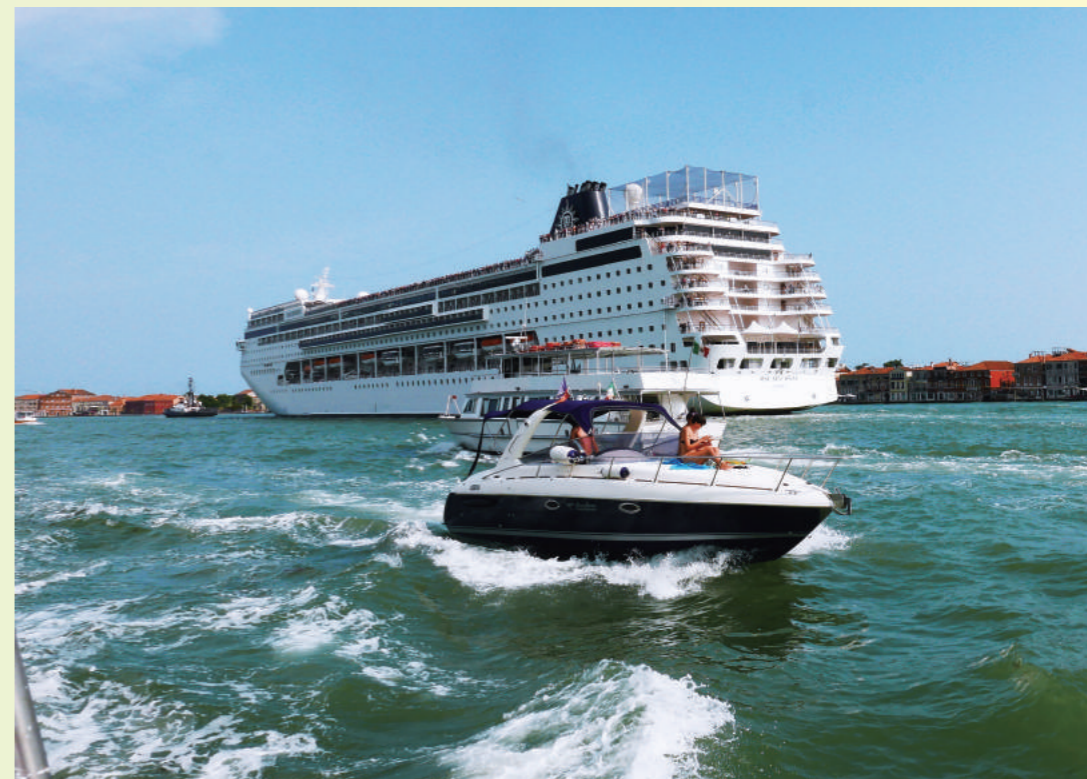
搭豪華遊輪旅遊世界各國是現今潮流。圖為地中海上的遊輪。

人生最美好的生活方式，莫過於和一群志同道合的好友奔跑在理想路上，回頭有一路的故事，低頭有堅定的腳步，抬頭有清晰的遠方，人生沒有重來，要好好把握每次機會，便是對人生最好的珍惜！（作者為本會雪梨分會會長）