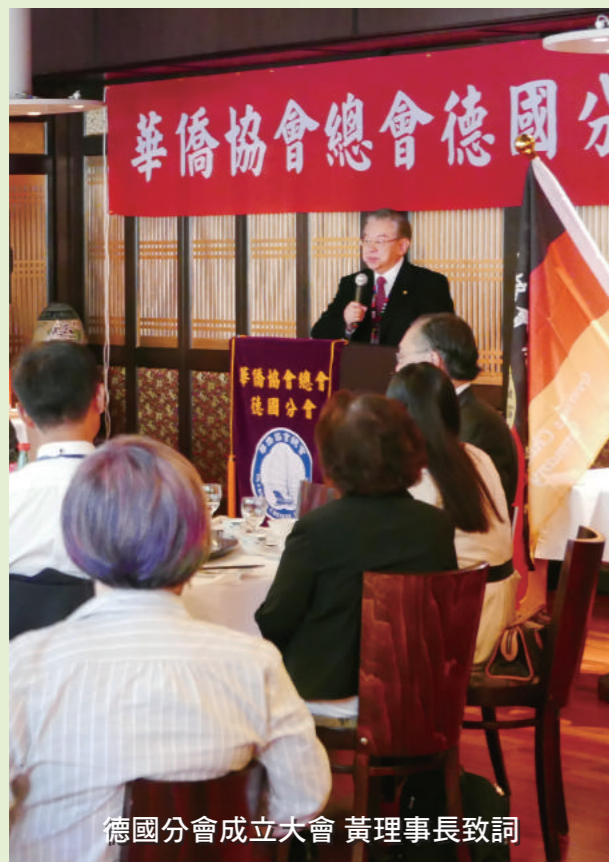
德國分會成立大會 黃理事長致詞