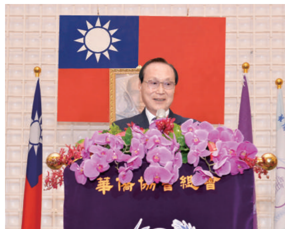
▲泰國華僑協會余聲清主席