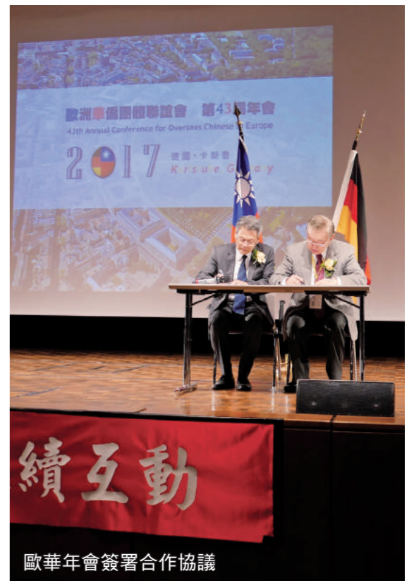
歐華年會簽署合作協議