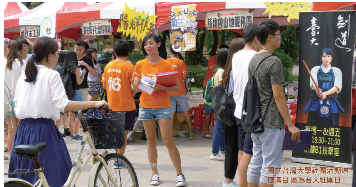
國立台灣大學社團活動琳瑯滿目 圖為台大社團日

紀念《大學雜誌》五十周年，至盼能喚起70年代的保釣精神，加上兩岸合作，必能保衛釣魚台，保障台灣漁民，也保衛中華民國的國土。（作者為知名作家）