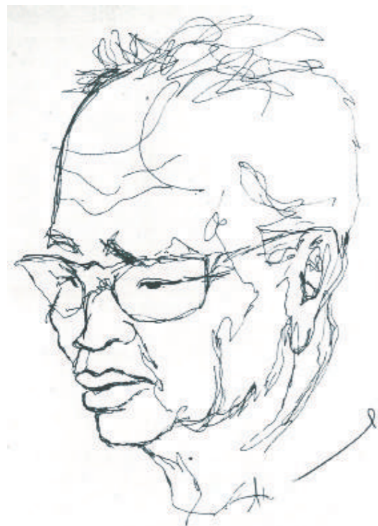
▲法國畫家達昂筆下的常玉速寫（1960年代）