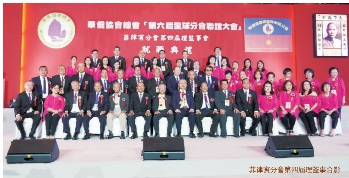
菲律賓分會第四屆理監事合影

嚴肅時刻結束，由菲律賓女歌手唱出「I am a woman」祝福母親節快樂，就在這首洋溢歡樂歌聲中，服務人員手捧精緻母親