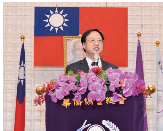
▲行政院前院長江宜樺