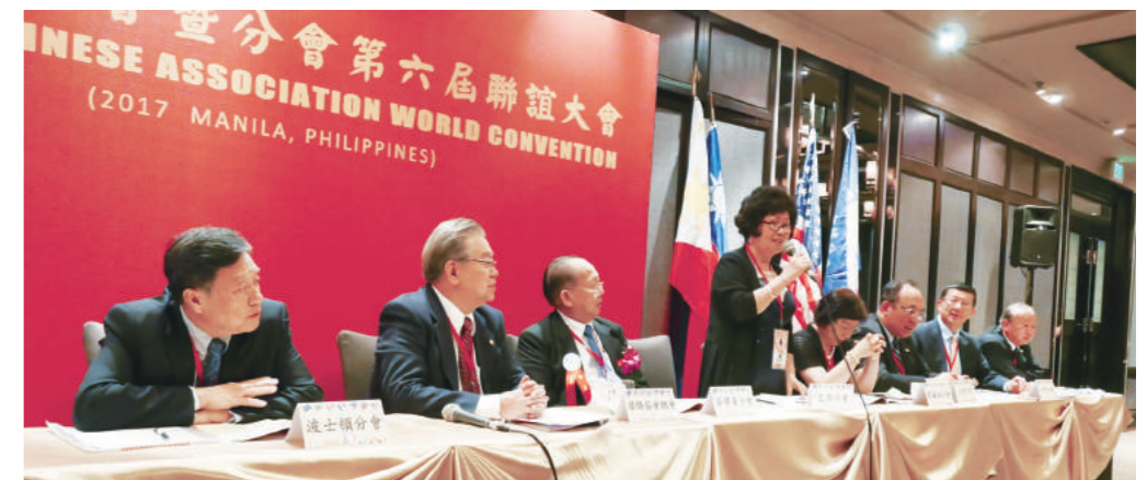
▲聯誼大會討論熱烈

金聲白說，多倫多分會結合蒙特婁分會，遊覽尼加拉大瀑布、渥太華、蒙特婁及魁北克，體驗英法兩國風情。