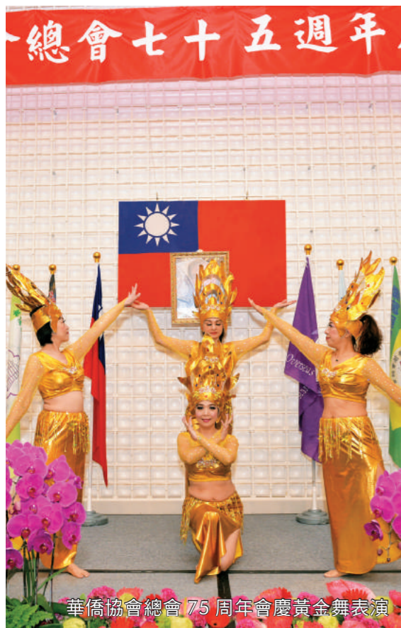
華僑協會總會 75 周年會慶黃金舞表演