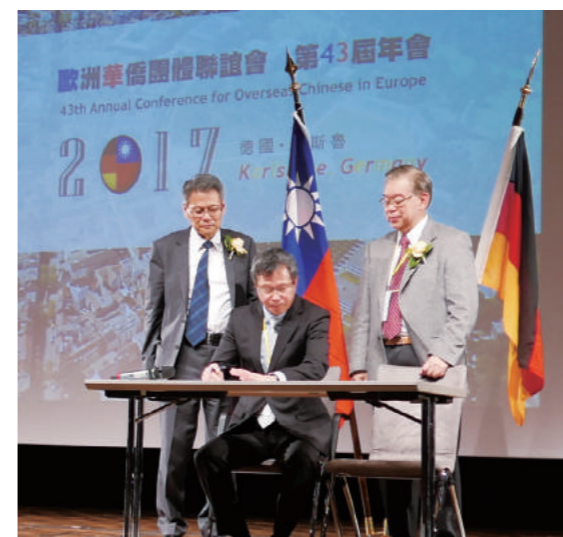
▲駐德國代表謝志偉大使簽署見證合作協議書