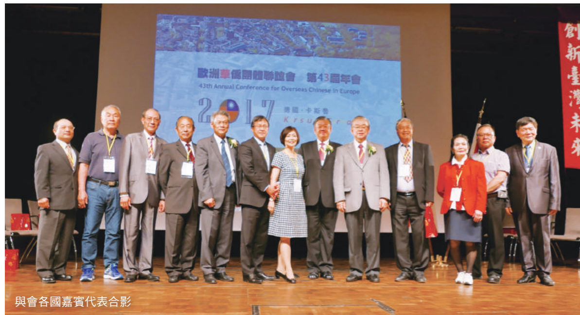
與會各國嘉賓代表合影