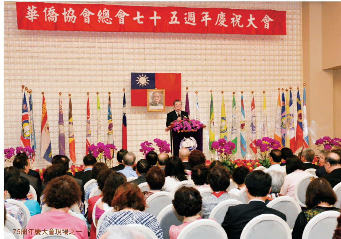
75周年慶大會現場之一