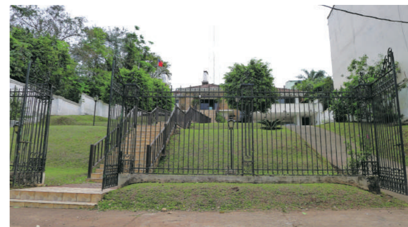
▲我國駐東方市總領事館

巴拉圭分會多予協助，共同增進中華民國與巴拉圭深厚情誼，為兩國外交關係做出貢獻。（編輯室）