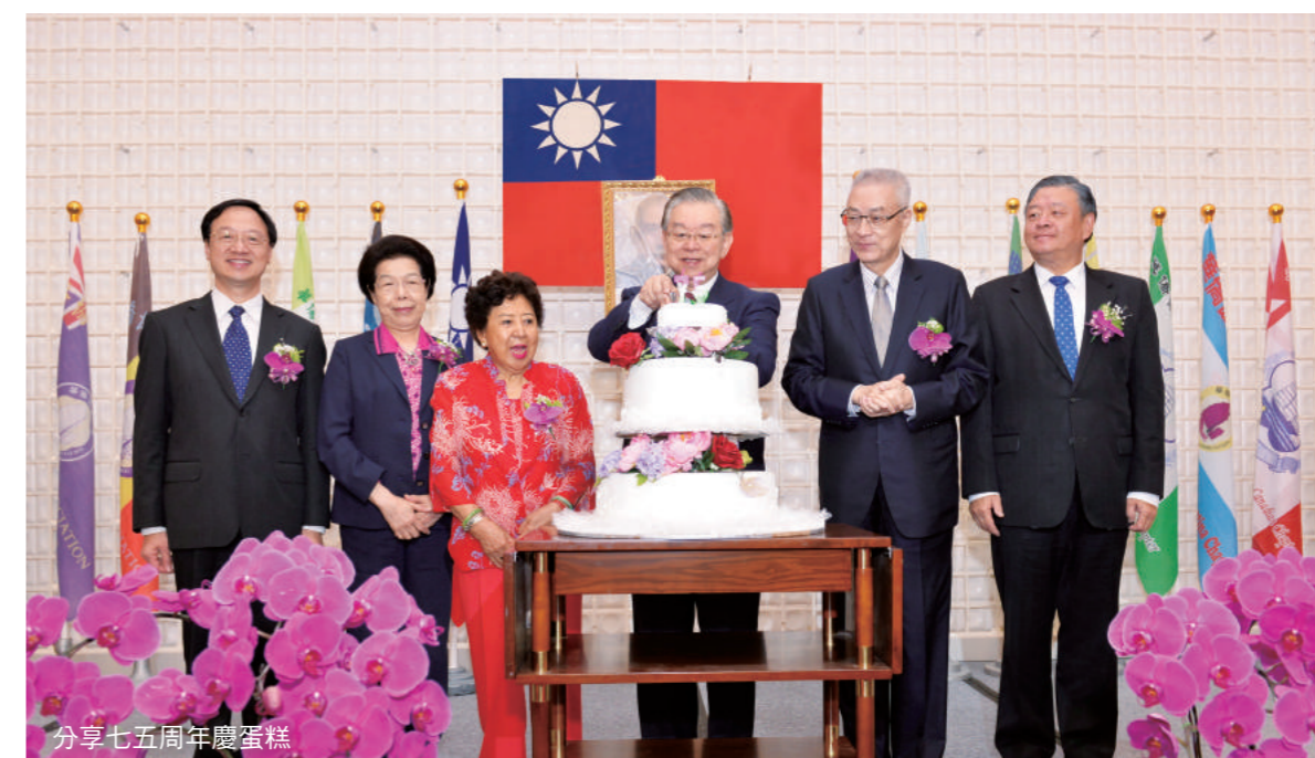
分享七五周年慶蛋糕

國父孫女孫穗芳博士希望華僑協會總會發揮凝聚海外僑心的關鍵力量，實現國父「和平 奮鬥 救中國」的遺願，促進兩岸和平統一。她說，她已經在全球各地發表一千三百多場中英文演講，捐獻國父銅像二百二十餘尊，宣揚國父理念，期盼兩岸早