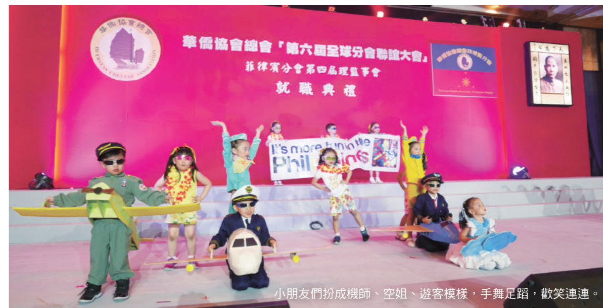
小朋友們扮成機師、空姐、遊客模樣，手舞足蹈，歡笑連連。