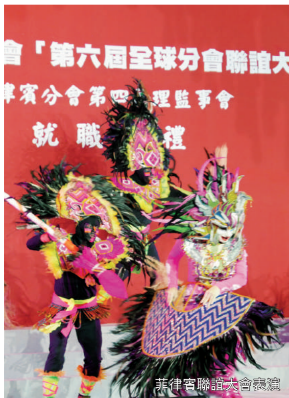
菲律賓聯誼大會表演