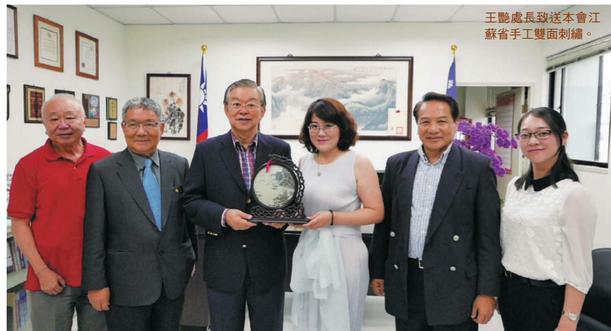
王艷處長致送本會江蘇省手工雙面刺繡。