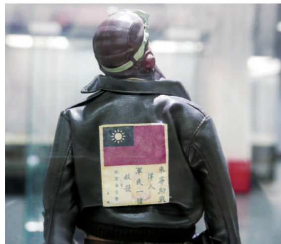
▲飛虎隊員配發的求救血符