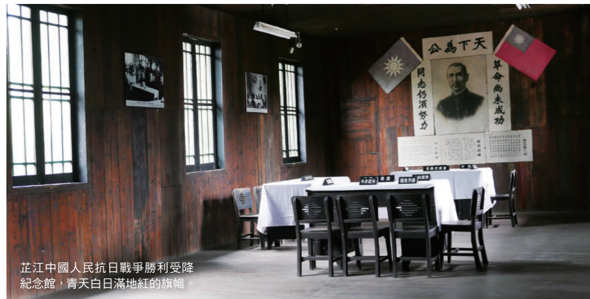
芷江中國人民抗日戰爭勝利受降紀念館，青天白日滿地紅的旗幟。