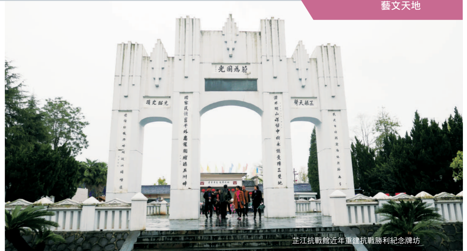
芷江抗戰館近年重建抗戰勝利紀念牌坊