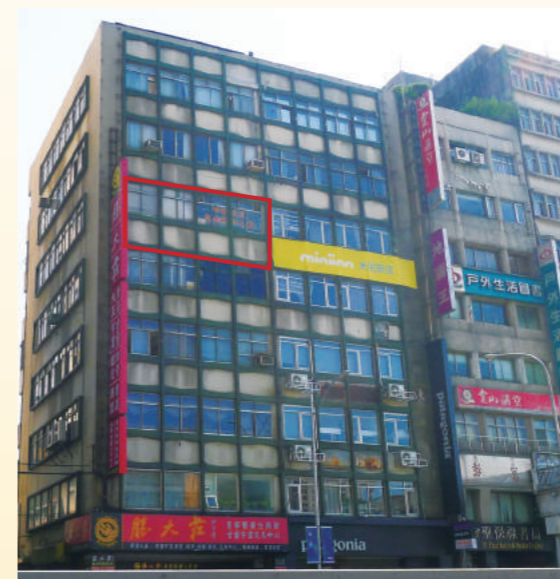
▲位於台北車站旁忠孝西路上的中華民國越南歸僑協會（紅框）