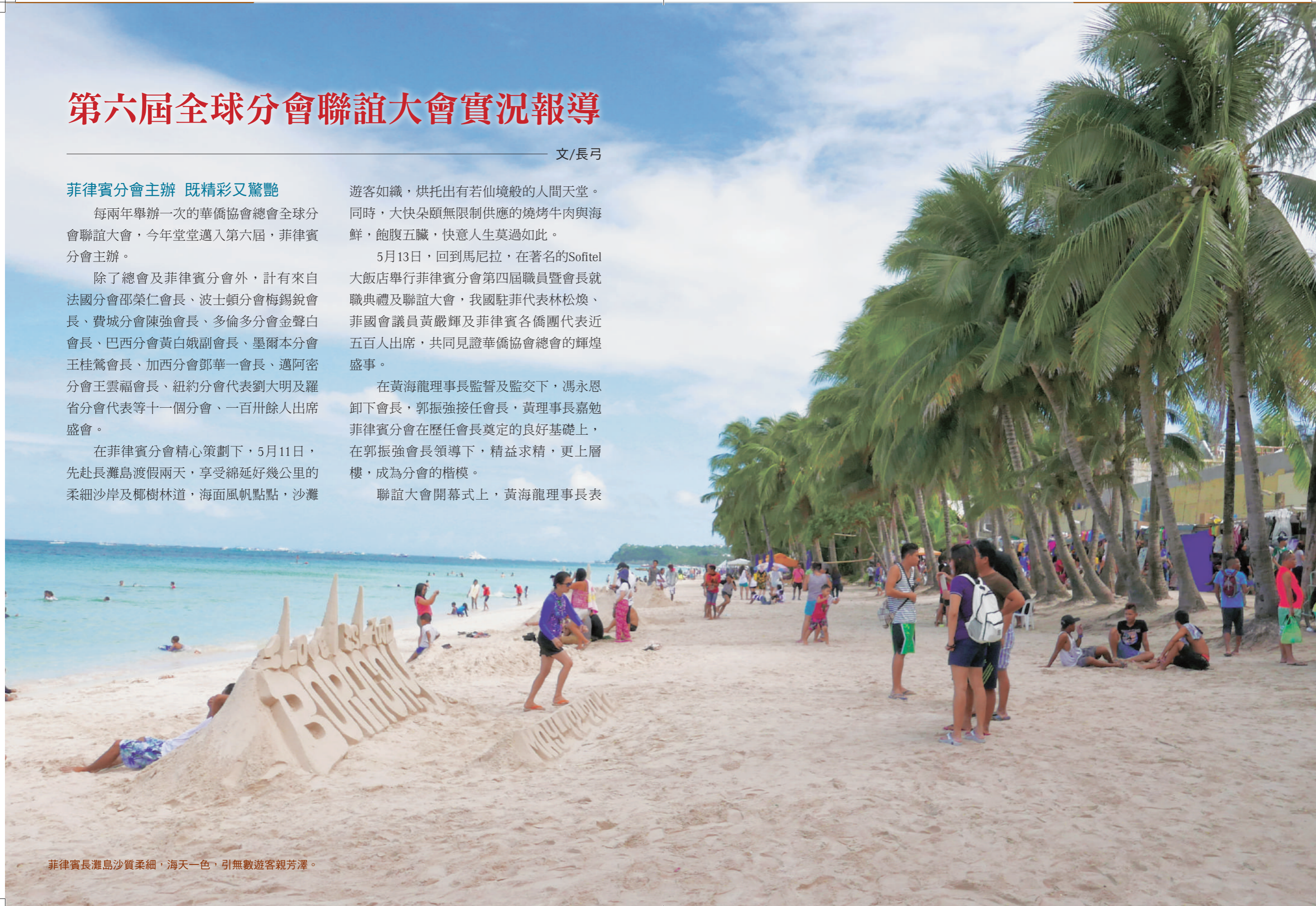
菲律賓長灘島沙質柔細，海天一色，引無數遊客親芳澤。