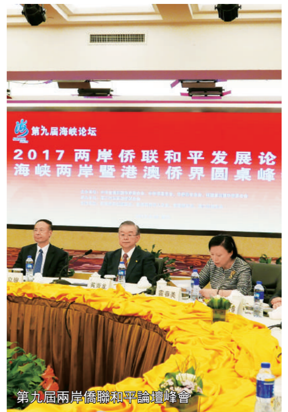
第九屆兩岸僑聯和平論壇峰會