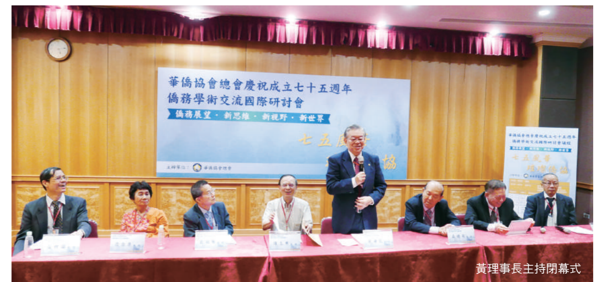
黃理事長主持閉幕式

黃理事長致送女性嘉賓每位一束紅色康乃馨，祝福她們母親節快樂，並邀請大家次日十時出席七五周年慶祝大會。（作者為本會會員）